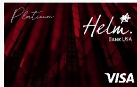
Helm Visa Platinum