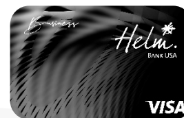
Helm Visa Business