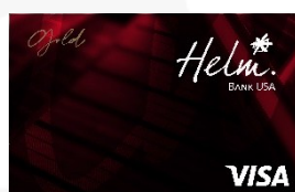
Helm Visa Gold