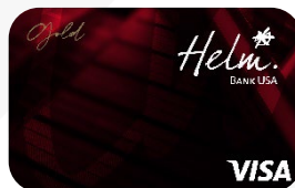
Cartão de débito