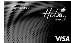
Helm Visa Business