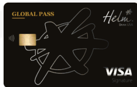
Helm Visa Global Pass