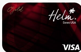
Helm Visa Gold