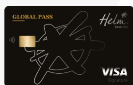
Helm Visa Global Pass